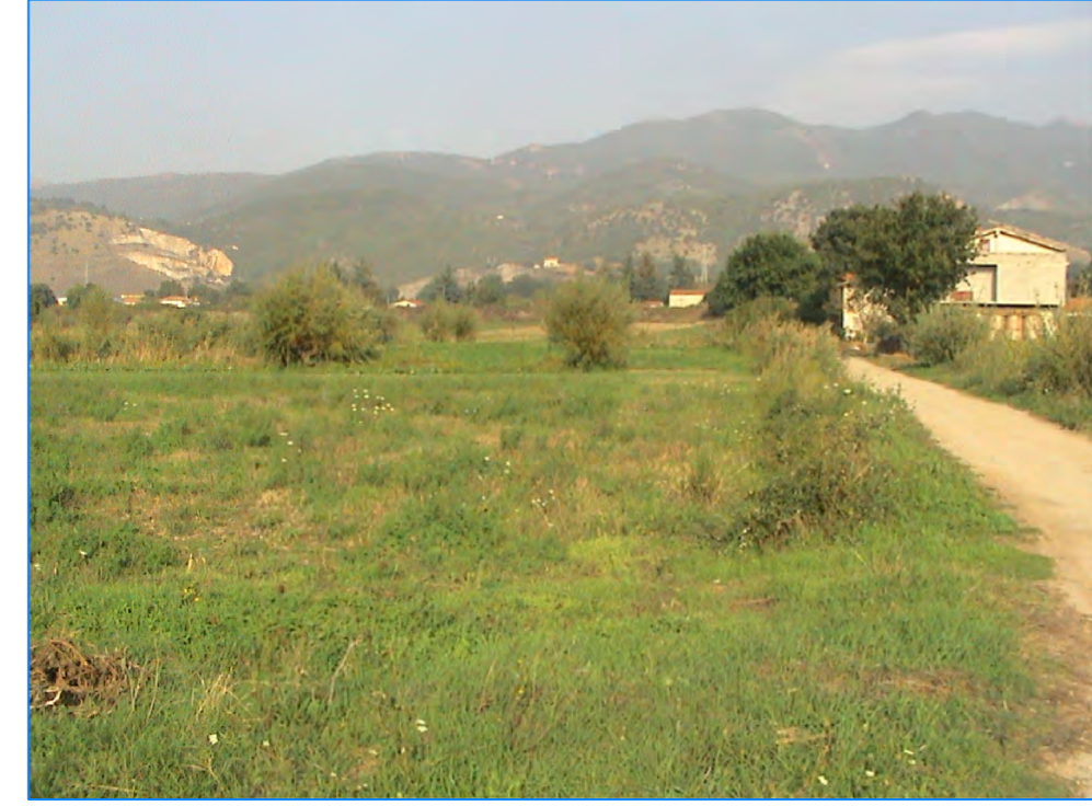
S t P1