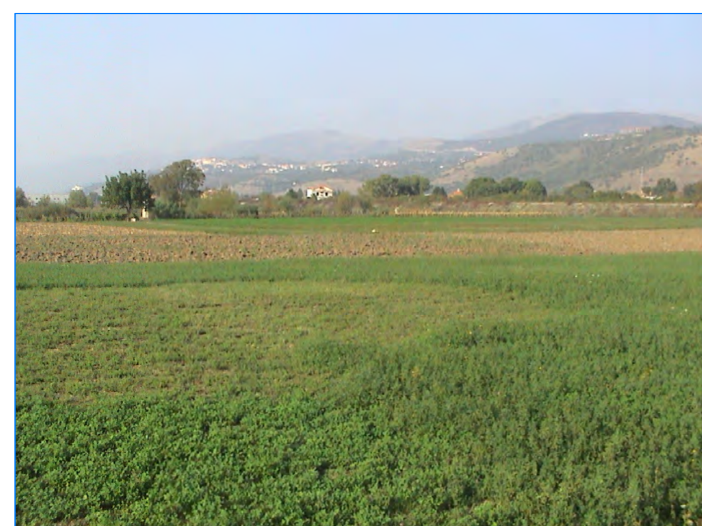
S tt 22