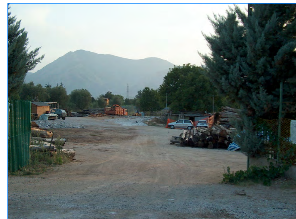
S t P16