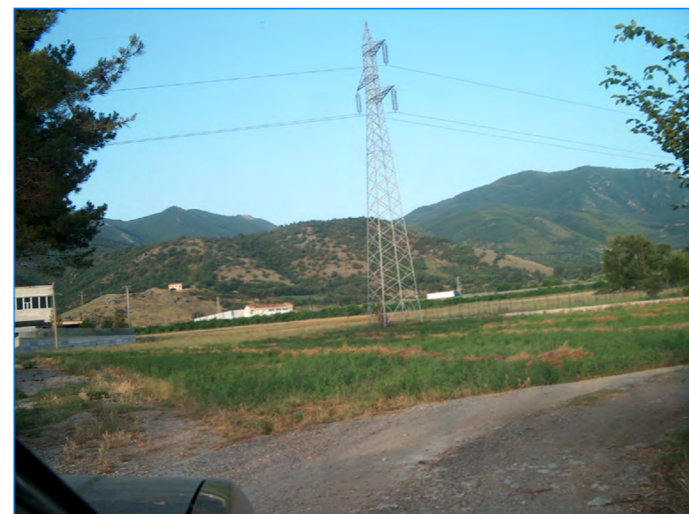
S t P19