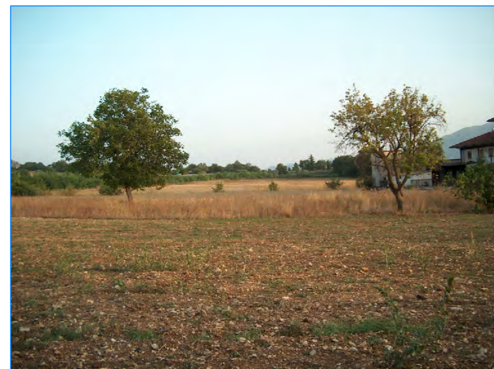
S tt 12