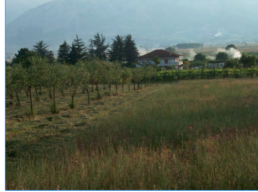
S t P4