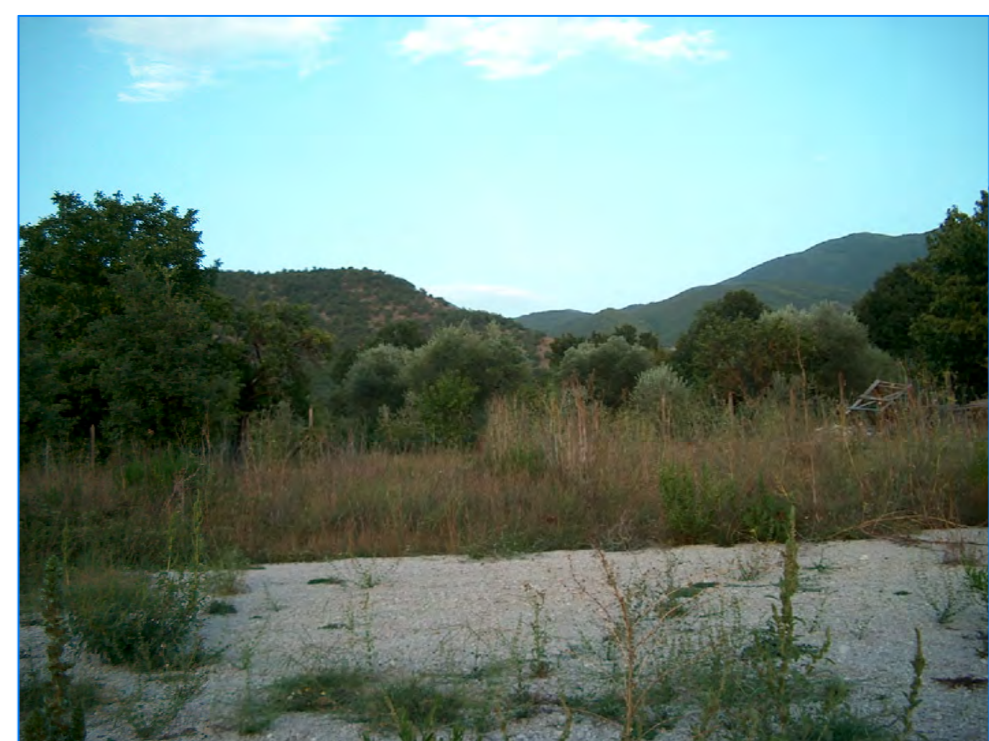
S tt 25