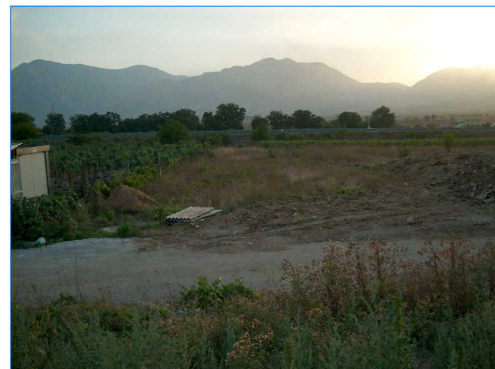
S tt 17