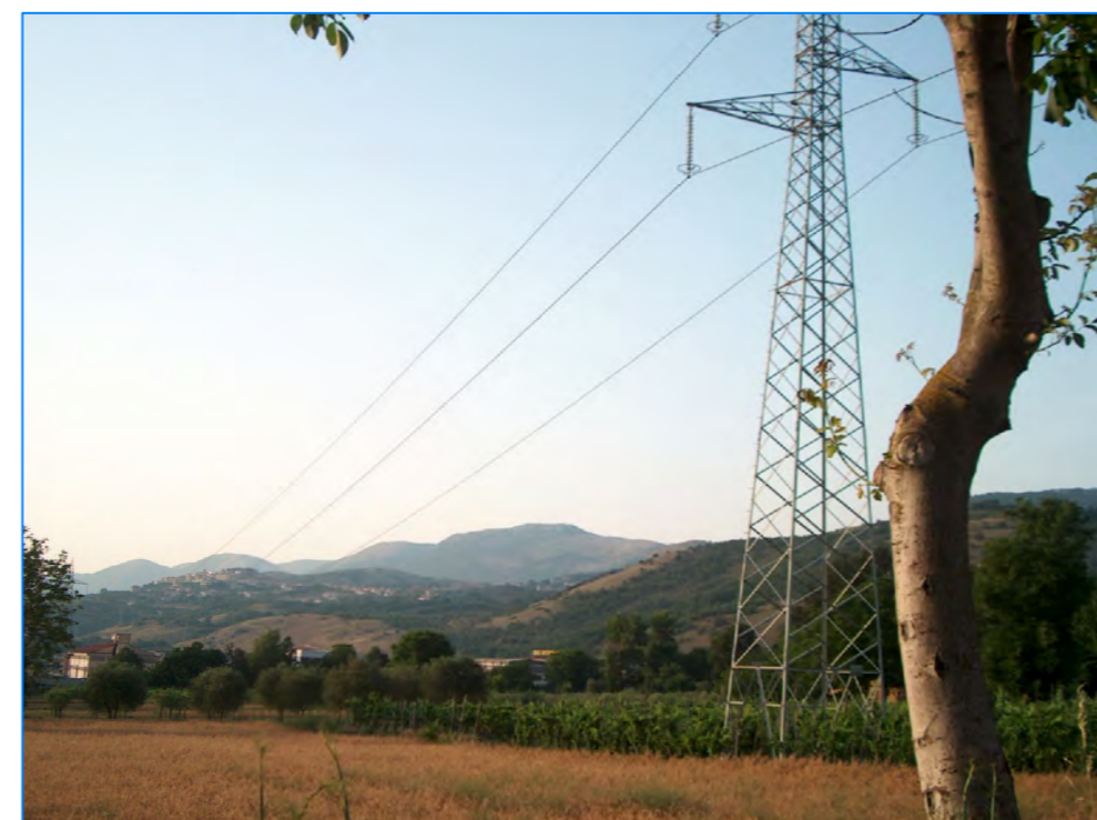
S t P14