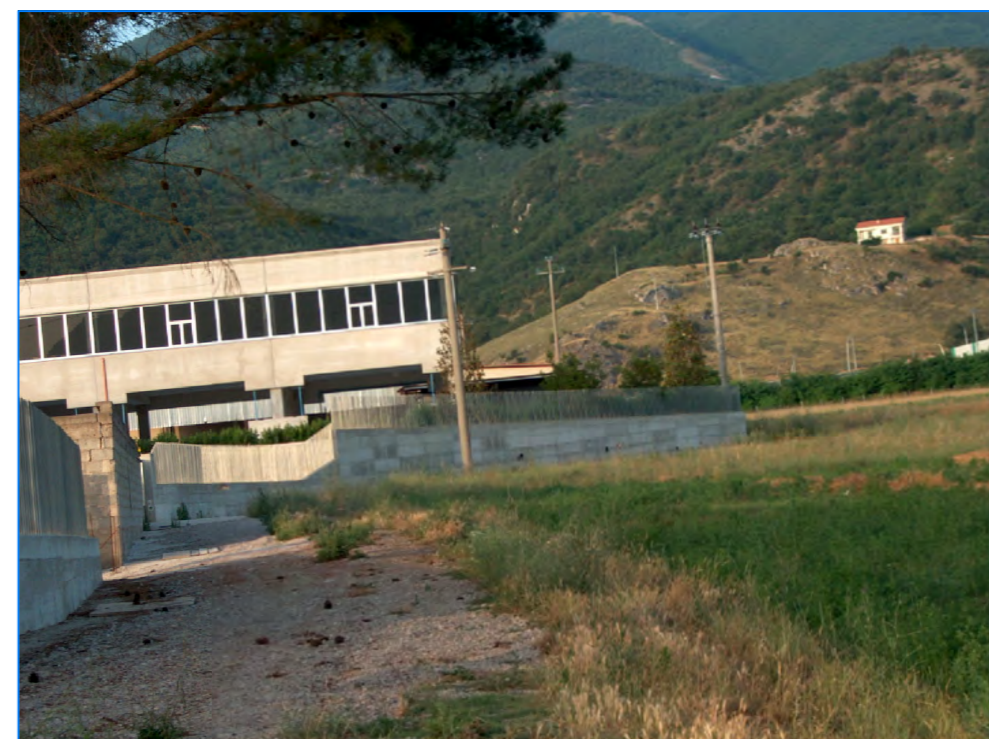
S tt 15