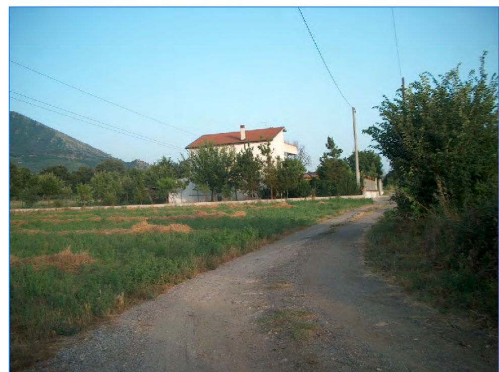
S tt 20