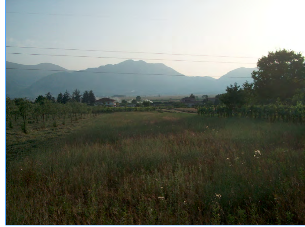
S tt 5