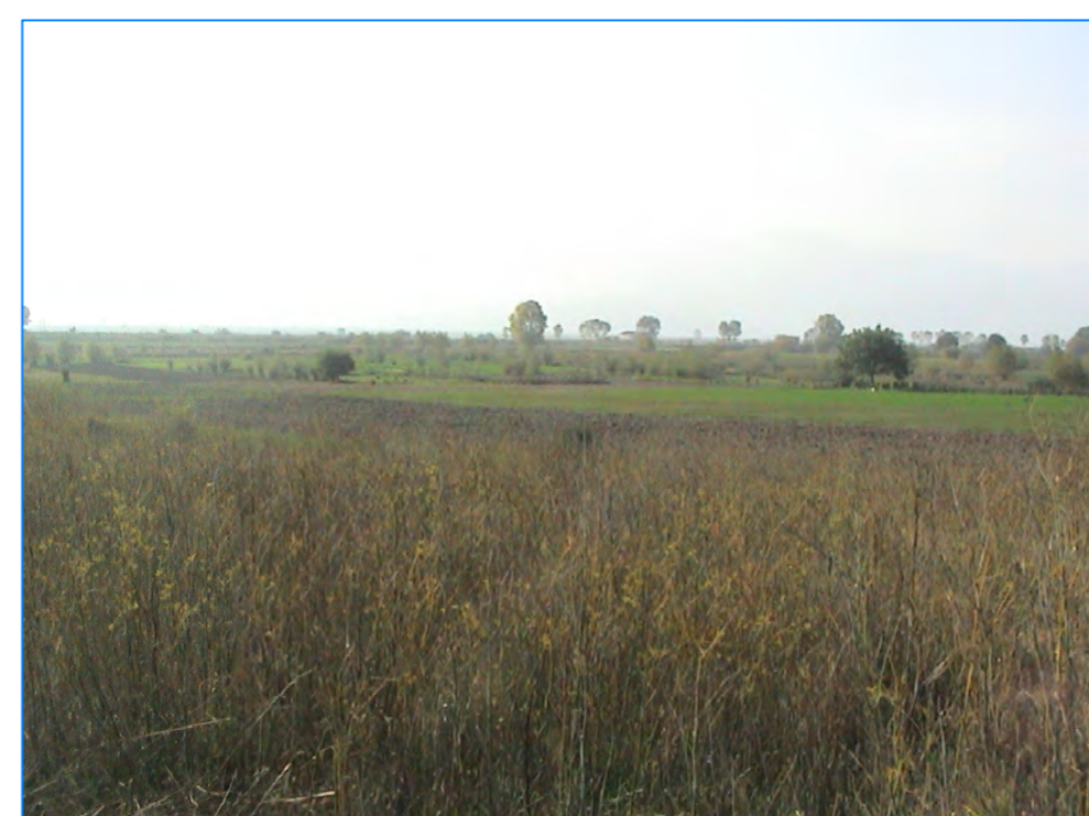
S t P24