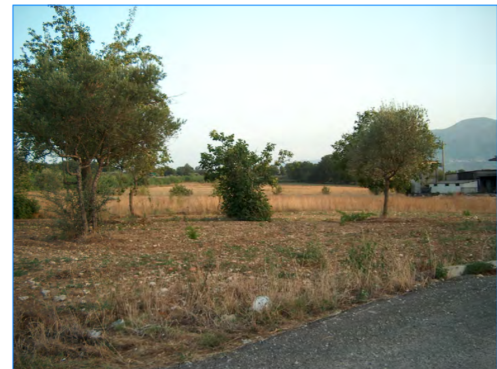
S t P11