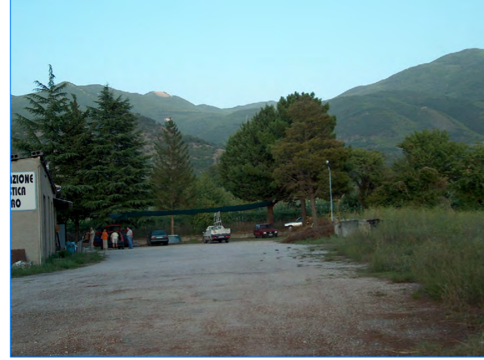
S tt 2