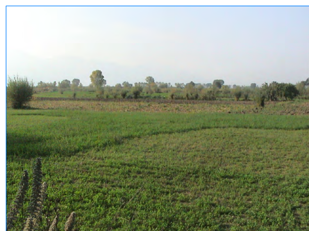
S t P3