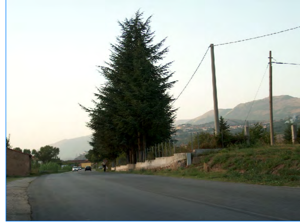
S t P3