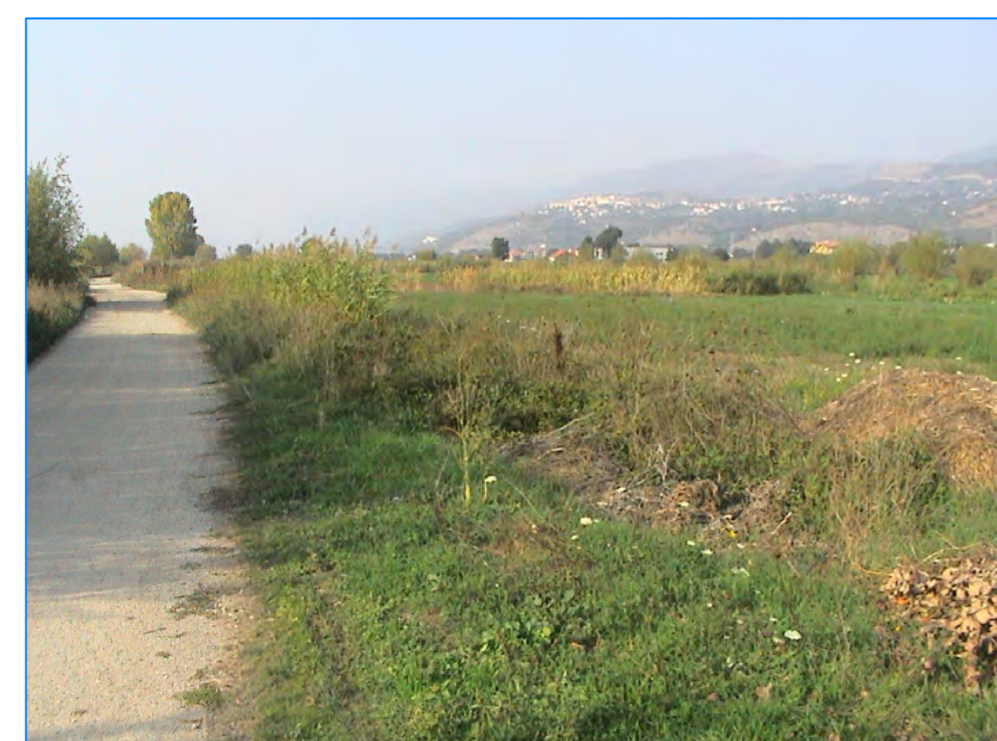
S t P21