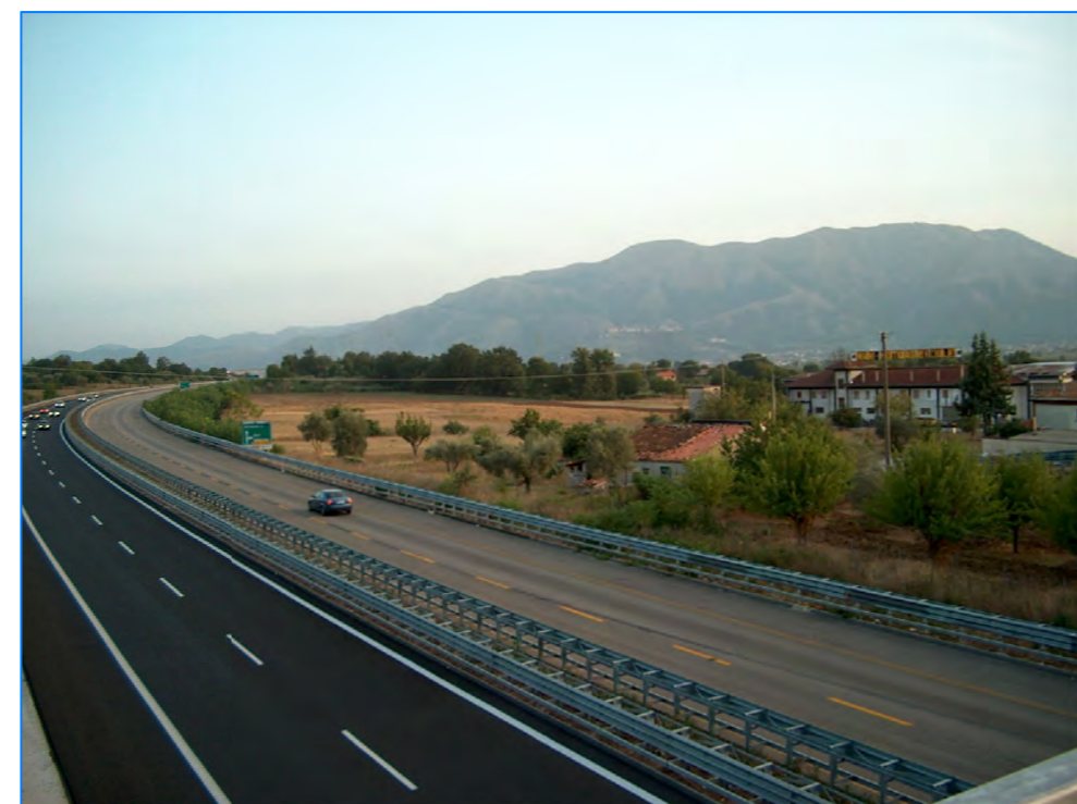
S t P3